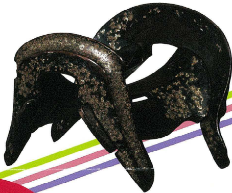
国指定重要文化財《巴螺鍔》 鎌倉時代前期(13世紀) 熊本県立美術館所蔵 前期展示:4月3日~5月16日