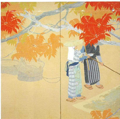
壑山南風《霜月頃》大正2年(1913) 熊本県立美術館所蔵